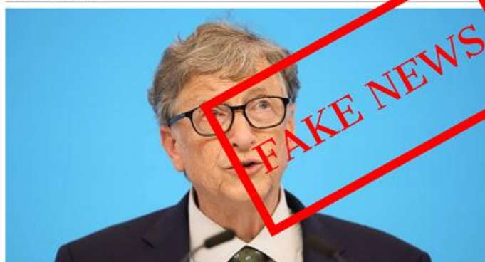
Bill Gates, fundador de Bill & Melinda Gates Foundation.

En una entrevista reciente que Bill Gates brindó en el canal CNBC de los Estados Unidos,