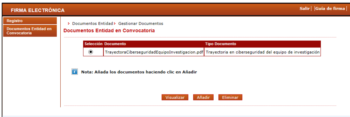
Figura 5 Pantalla adjuntar documento

Importante: Comprobar que se han adjuntado correctamente los 5 documentos