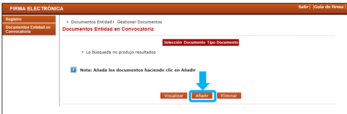
Figura 3 Pantalla gestionar documentos

Importante: El documento de declaración responsable del representante legal debe ser firmado digitalmente antes de adjuntarlo.