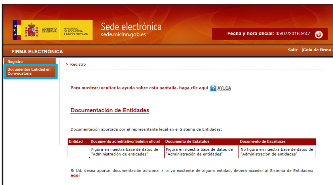
Figura 1 Pantalla registro firma

Después de hacer login con el usuario del centro I+D+i, el primer paso es acceder al enlace de Documentos Entidad en Convocatoria :