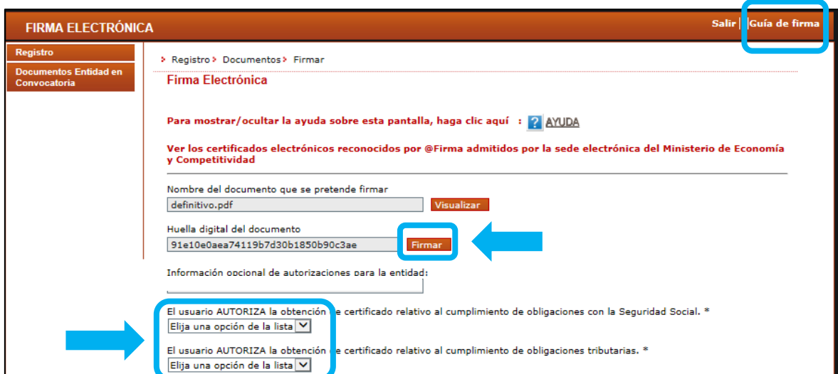
Figura 9 Firma

Tras haber pulsado el botón de Firmar y registrar, finalmente se accede a la pantalla de firma, donde volverá a ofrecerse la posibilidad de visualizar el documento a firmar.