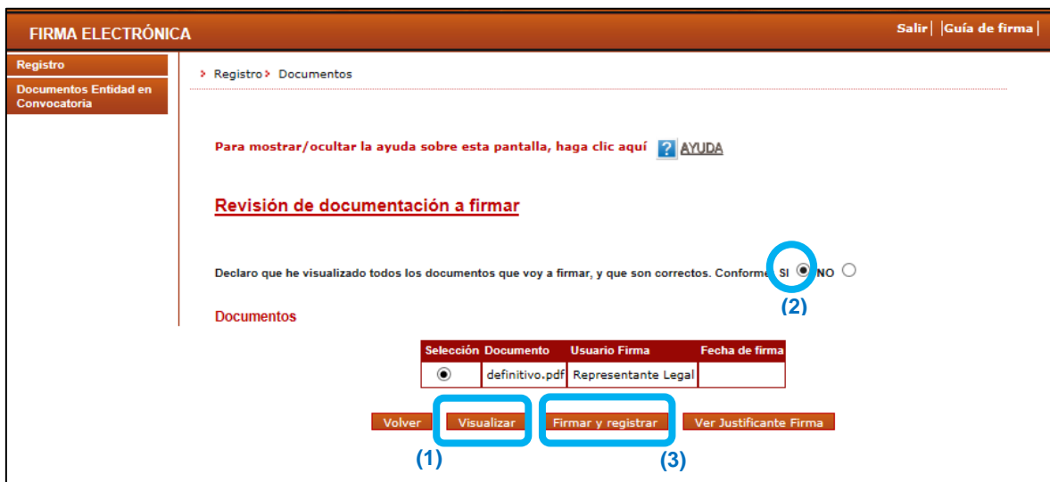
Figura 8 Firmar y registrar

El documento que se va a firmar con este procedimiento es el de la solicitud de la ayuda únicamente. Por otra parte, como se comentó en el apartado “2.2.2 Añadir documentos” existe otro documento que debe adjuntarse ya firmado y es el relativo a la declaración del representante legal.