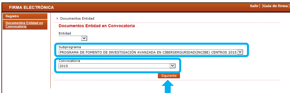
Figura 2 Pantalla documentos entidad