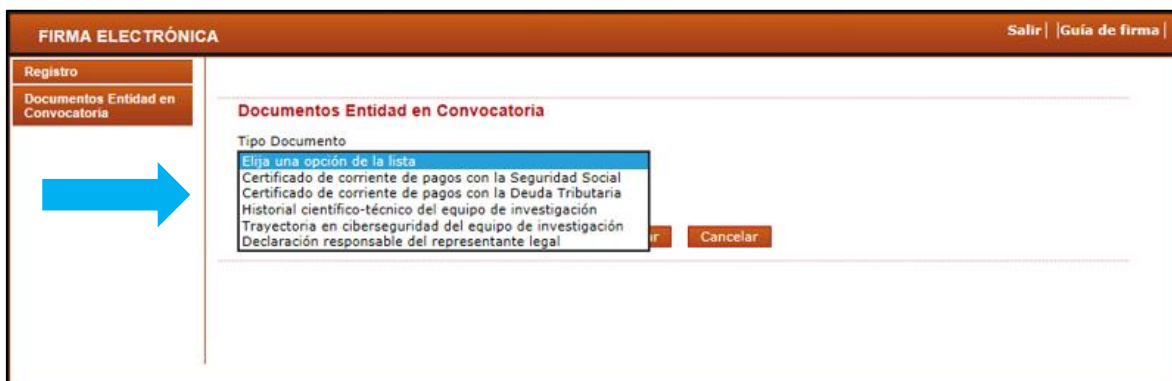
Figura 4 Pantalla seleccionar documento