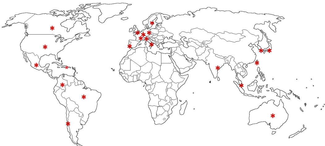
Ilustración 2: Mapamundi con los 22 países prioritarios para la industria española de ciberseguridad

En concreto, INCIBE ha identificado un total de un total de 22 países prioritarios para la industria española de ciberseguridad, en base al tamaño de sus mercados y perspectivas de crecimiento. Las acciones de internacionalización de la industria española de ciberseguridad impulsadas por INCIBE tendrán como destino prioritario alguno o varios de los 22 países.