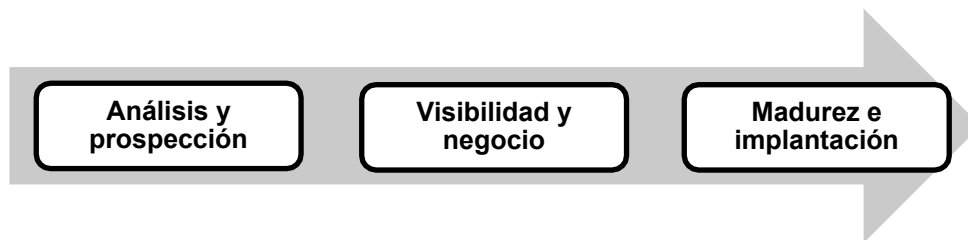
Ilustración 1: Fases del proceso de internacionalización de la industria ciberseguridad española

Dentro de la 2ª fase del proceso de internacionalización, ‘visibilidad y negocio’, la asistencia a eventos internacionales de ciberseguridad y la organización de misiones comerciales internacionales cobra una especial relevancia.