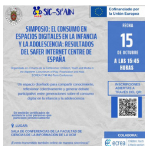
Imagen 23. Cartel promocional del Simposio