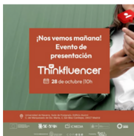
Imagen 20. Creatividad promocional del evento