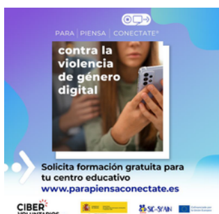
Imagen 14. Cartel de la campaña