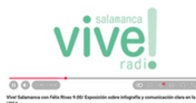
Imagen 30. Banner promocional