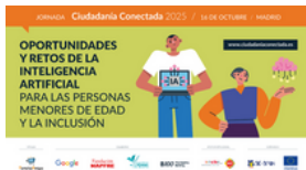
Imagen 37. Cartel de la jornada