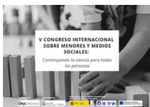
Imagen 28. Cartel promocional del congreso