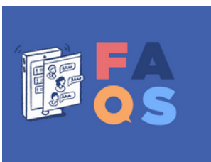
Imagen 18. Creatividad de la campaña