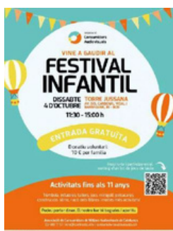
Imagen 2. Imagen del cartel