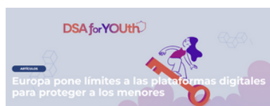
Imagen 19. Creatividad del artículo