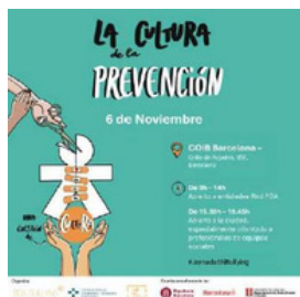
Imagen 3. Imagen del programa