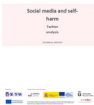
Imagen 34. Banner promocional