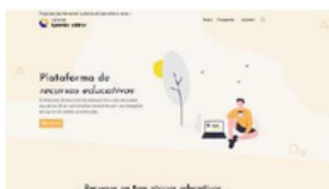
Imagen 5. Captura de la Plataforma de recursos educativos