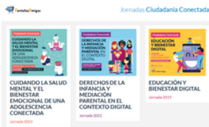
Imagen 38. Imagen de las Jornadas Ciudadanía conectada