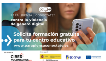
Imagen 13. Creatividad de la campaña