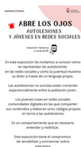
Imagen 32. Cartel informativo de la exposición