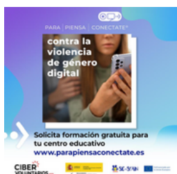
Imagen 11. Creatividad de la campaña