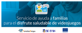
Imagen 36. Banner promocional