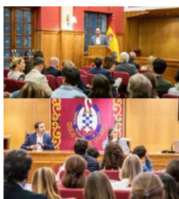
Imagen 7. Imagen de la Jornada