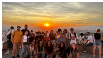
Imagen 21. Grupo de participantes