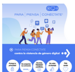
Imagen 12. Cartel promocional de los talleres