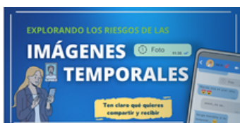
Imagen 25. Imagen de la iniciativa