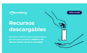
Imagen 15. Creatividad de la campaña