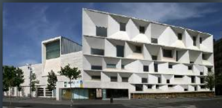
3 AUDITORIO CIUDAD DE LEÓN