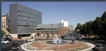
4 AUDITORIO CENTRO CÍVICO "LEÓN OESTE"