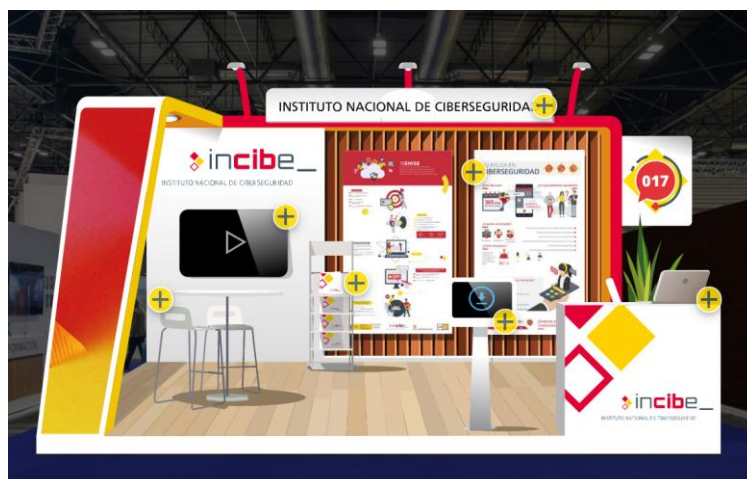
Figura 1. Stand virtual de INCIBE 15ENISE